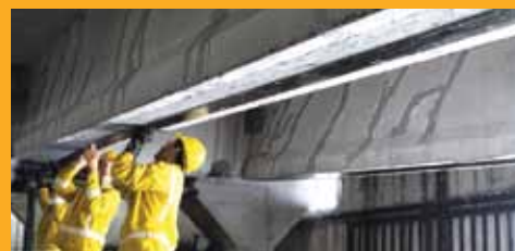
REPARACIONES Y REFUERZO