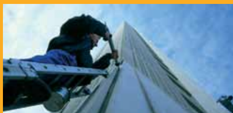
PEGADO Y SELLADO